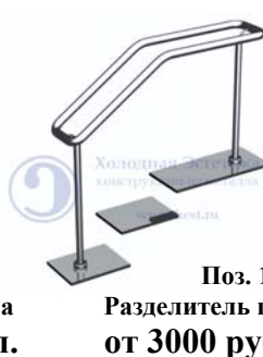
Поз. 12 Разделитель потоков. от 3000 руб./м.п.