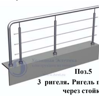
Поз.5 3 ригеля. Ригель пропущен через стойку 4700 руб./м.п.