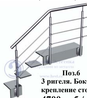
Поз.6 3 ригеля. Боковое крепление стойки 4700 руб./м.п.

Ограждающие конструкции с заполнением из стекла.