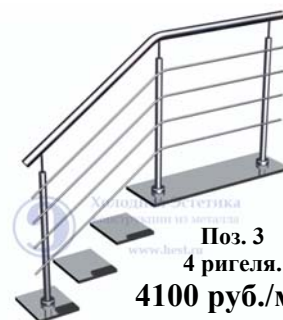
Поз. 3 4 ригеля. 4100 руб./м.п.

Лестничные ограждения с ригелями, установленными на выносных кронштейнах (бочонках).