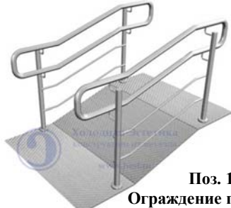
Поз. 11 Ограждение пандуса от 4500 руб./м.п.