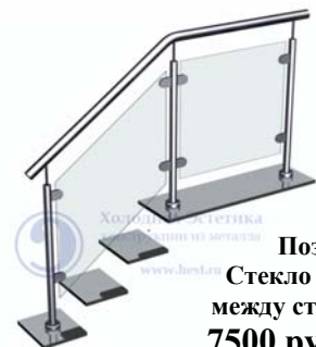
Поз. 7 Стекло (9 мм) между стойками 7500 руб./м.п.

Ограждающие конструкции с заполнением из стекла.