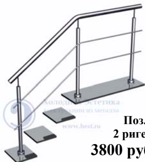
Поз.1 2 ригеля. 3800 руб./м.п.

Лестничные ограждения с ригелями, установленными на аргоно-дуговой сварке.