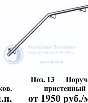
Поз. 13 Поручень прстенный от 1950 руб./м.п.

В типовых конструкциях используется поручень диаметром 51 мм, стойки диаметром 38 мм, ригель диаметром 16 мм, стекло триплекс толщиной 9 мм. Обработка поверхности: полировка либо шлифовка. Ограждения выполняются с соблюдением ГОСТов и СНИПов.