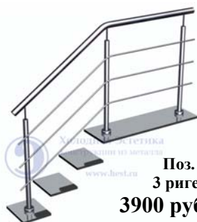
Поз. 2. 3 ригеля. 3900 руб./м.п.