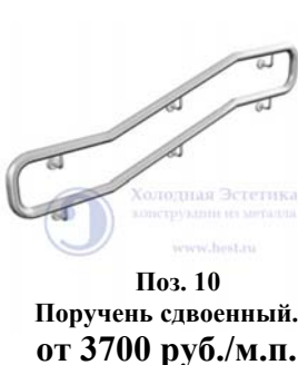
Поз. 10 Поручень сдвоенный. от 3700 руб./м.п.

Ограждения для инвалидов (маломобильных групп населения).