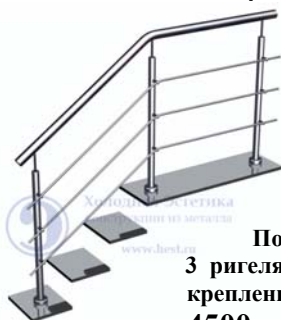
Поз. 4 3 ригеля. Верхнее крепление стойки 4500 руб./м.п.

Лестничные ограждения с ригелями, установленными на выносных кронштейнах (бочонках).