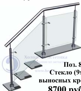
Поз. 8 Стекло (9мм) на выносных кронштейнах 8700 руб./м.п.